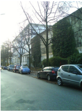
Bunker in der Humboldtstraße