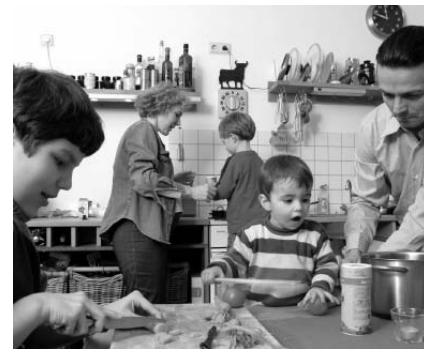
An der Familienfreundlichkeit fehlt es Hamburg noch für ein echtes Wachstum.

Kritisch sieht der „Monitor Wachsende Stadt“ die Entwicklung im Bildungsbereich. So verließen mit 11,5 Prozent im Großstadtvergleich überdurchschnittlich viele Jugendliche die Hauptschule ohne einen Abschluss, unter den Migranten sind es gar rund 20 Prozent. Zudem sind die Ausgaben für Forschung und Entwicklung in Hamburg unterdurchschnittlich mit Rang 12 unter den 16 Bundesländern. Und die Studienzeiten sind zu lang. „Während der Mangel an Hoch-